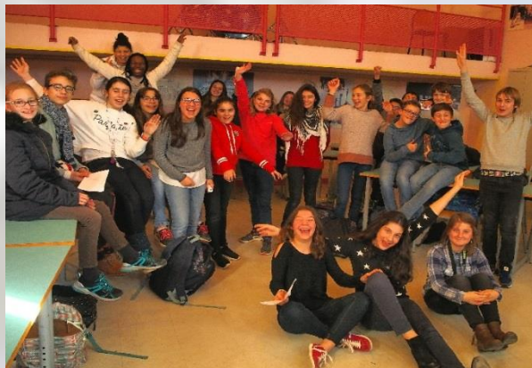
La chorale du collège version 2018

On attend avec impatience l'édition 2019 et merci au Foyer Culturel Laïque pour ce Festival.